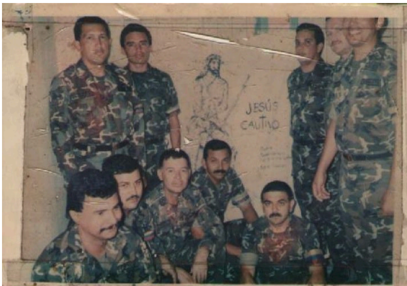
La banda de delincuentes